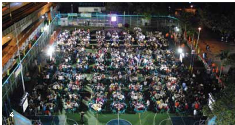
圖4 金禧校慶啟動禮當晚，眾人濟濟一堂，於操場筵開一百零八席。