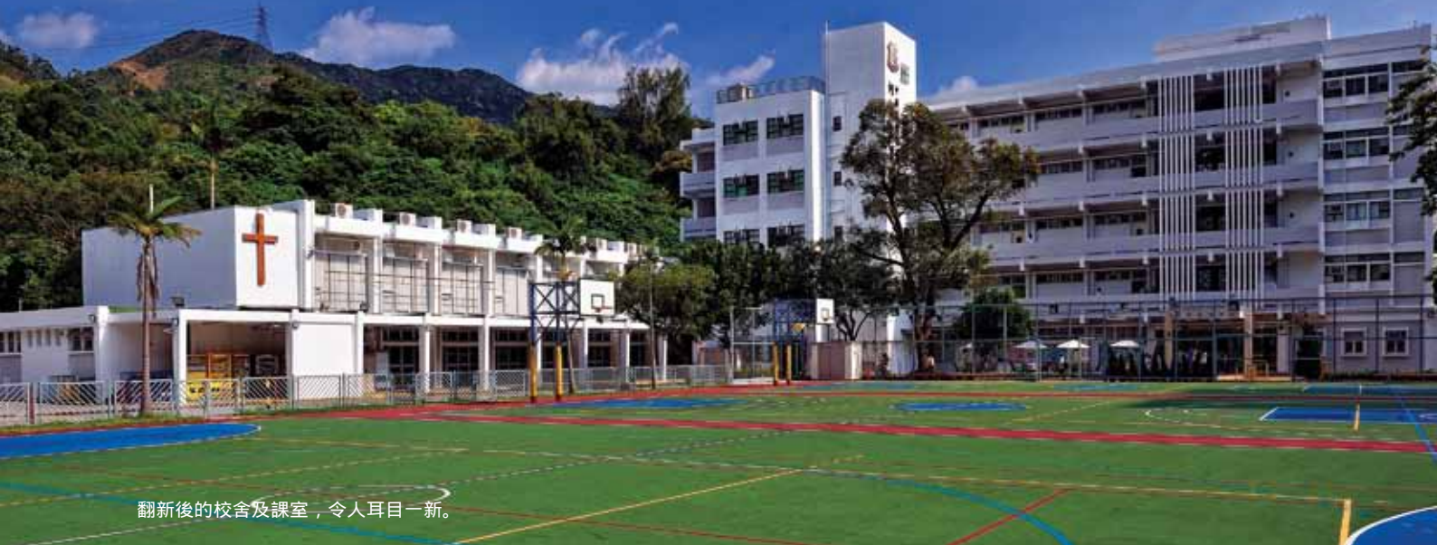
翻新後的校舍及課室，令人耳目一新。