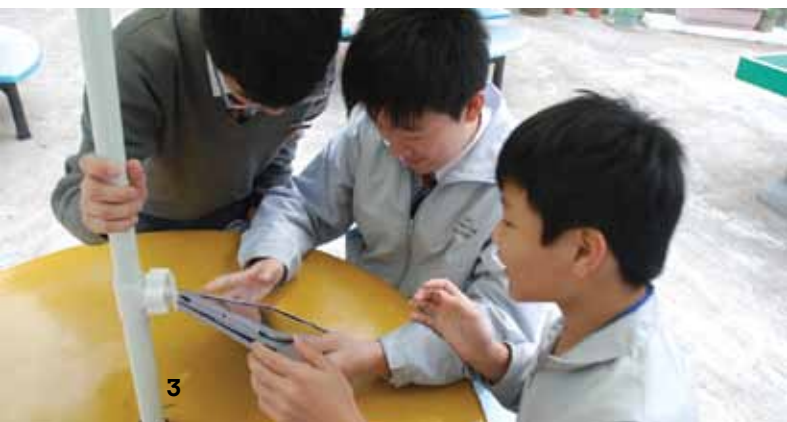
圖3 學生以新購入的iPad進行課堂活動。