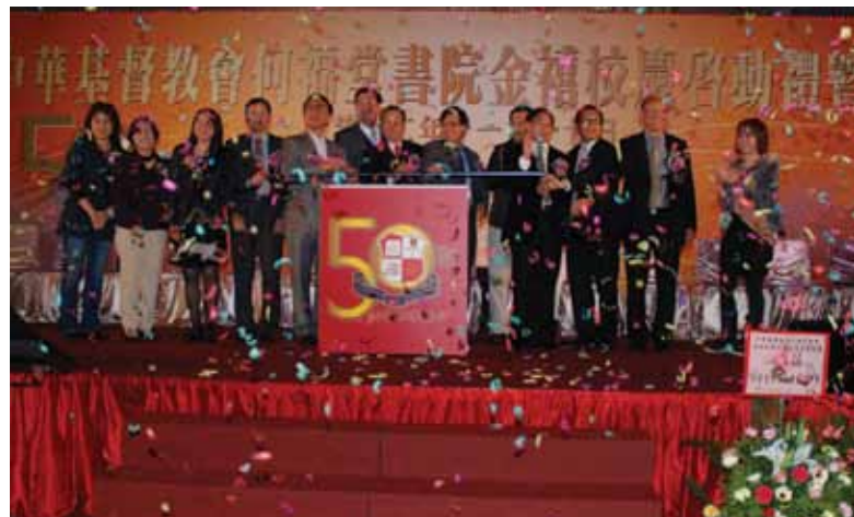
眾嘉賓為金禧校慶啟動禮主持亮燈儀式。

而另一重大的校慶活動為於二零一二年十二月十八日舉行的同心同行賀金禧步行活動。顧名思義，此次步行活動是希望讓全校師生並肩攜手，一起見證福堂金禧。當天早上，畢業班的學生及老師穿上各班設計的班衫，以不同顏色的班衫於操場上砌出「CCC HFTC 50」的字樣，然後，校長連同主禮嘉賓屯門警區副區指揮官霍樂生高級警司與砌字師生拍攝大合照，紀念母校金禧校慶。接著，由霍高級警司主持起步禮，並在葉校長的帶領下，師生一同由母校出發，沿路由警察及輕鐵職員指揮交通，步行前往屯門鄧肇堅運動場，開展一連兩日的陸運會。這次全校參與的校慶活動，不僅提高了師生對學校的歸屬感，亦有助建立班風，並藉此身體力行的參與，推廣健康生活及運動的重要性。雖然拍大合照及步行期間巧遇天雨，但仍無阻活動進行，全校上下於風雨中仍能團結一