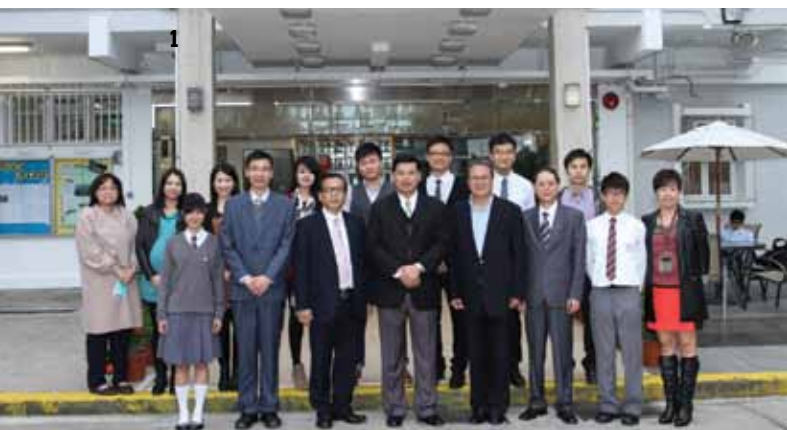
圖1 不同屆別的學生會主席也到場參加更換歷屆學生會幹事名單牌儀式。