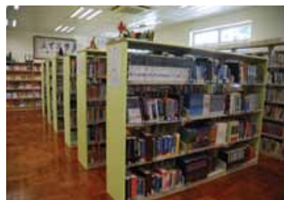
圖書館的書架加高後，藏書量增加不少。

總括而言，母校在過去半世紀中不斷努力求進，儘管今日已稍見成果，但她卻永不停步，決心要精益求精。未來，我相信母校上下定必群策群力，再攀越一個又一個的高峰。