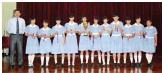
女子丙組排球隊於屯門區學界比賽中勇奪冠軍。 一眾女子排球隊成員與特地到場支持他們的校長、家長、校友合照。

課外活動方面，母校不僅在不同的課外活動上屢獲殊榮，尤令人可喜的是在體育比賽方面，母校的女子隊伍於上一年度學界體育比賽中，整體成績成功晉身全區八強，更獲最佳進步獎，表現令人鼓舞。其中女子丙組排球隊於多番比賽中團結一致，奮戰到底，終擊敗區內強勁對手，成功奪得冠軍寶座，為本校的各個體育隊伍打了一支強心針。今後，母校各體育隊伍及其他課外活動小組將保持一貫積極求進的態度，追求卓越，盼於日後有更佳的發揮。