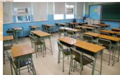
課室重鋪地氈後的新面貌。

母 校五十周年校慶的大日子正式來臨，新舊校友聚首一堂，歡騰慶賀之際，當然也關心母校最新的動態吧！