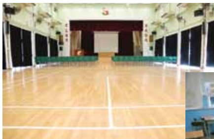
禮堂裡裡外外均全面翻新。