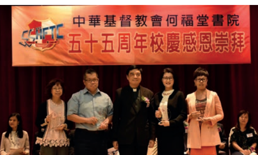
老師職工領取服務獎 (4)