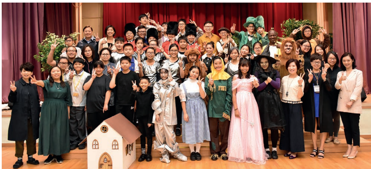
English Drama Club 2018 (Wizard of Oz)