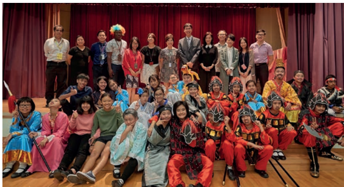
English Drama Club 2017 (Mulan)