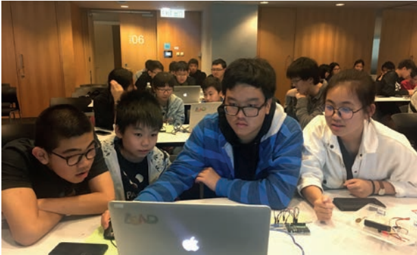
編程小組出外學習