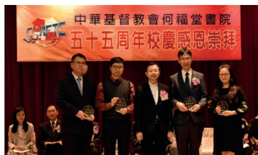
老師職工領取服務獎 (5)