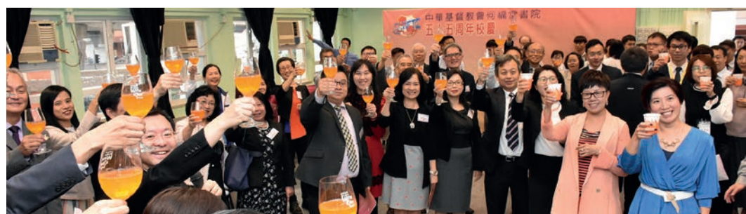
嘉賓老師舉杯慶祝