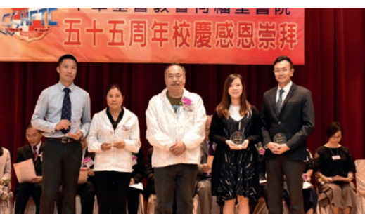
老師職工領取服務獎 (7)