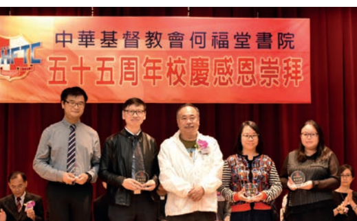
老師職工領取服務獎 (1)