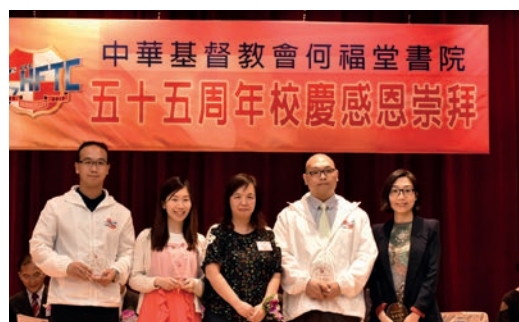
老師職工領取服務獎 (2)