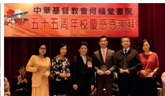
老師職工領取服務獎 (6)