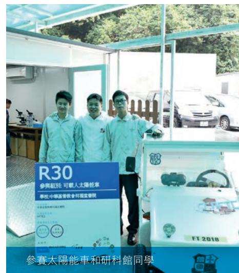
參賽太陽能車和研科館同學