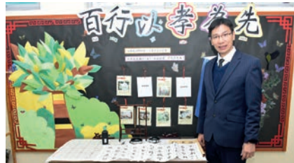
文萃軒本年主題 (孝)