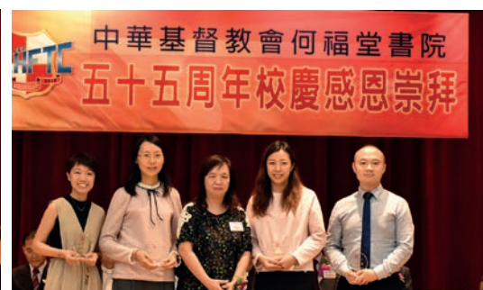
老師職工領取服務獎 (3)