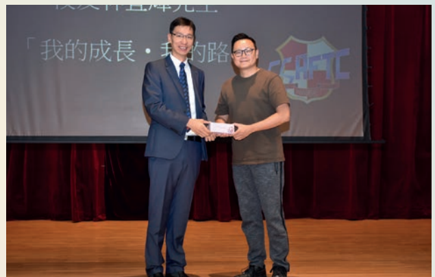
校長致送紀念品給校友