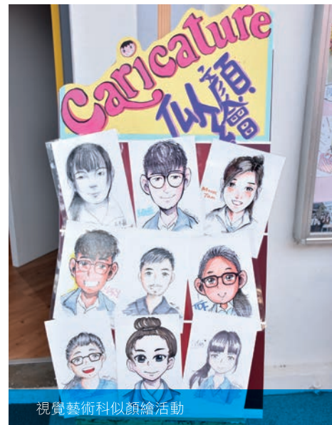
視覺藝術科似顏繪活動

另一邊廂，正門大道上各個學習領域紛紛設置大大小小的攤位，展示各學科教學成果和研議的材料。其中，場面熱鬧非常，摩肩接踵，可謂盛況空前！是年新成立的中國鼓隊更有快閃表演，夾着其他樂器輪流表演，笙歌鼎沸，歡聲雷動！