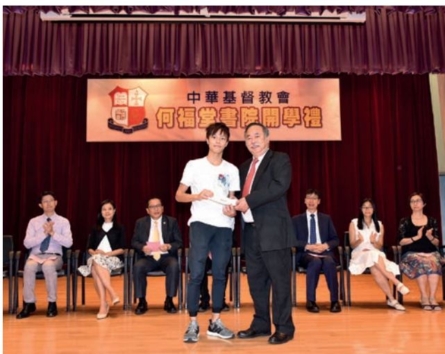
文憑試成績優異學生領獎