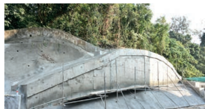
斜坡進行修葺工程