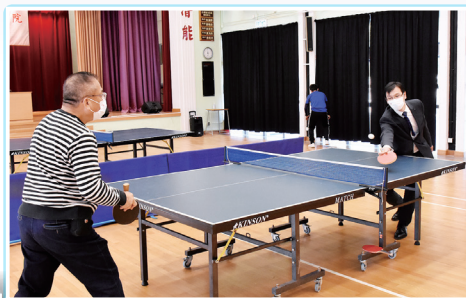
CCC Hoh Fuk Tong College 中華基督教會 何福堂書院