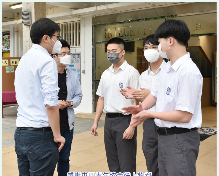
感謝屯門青年協會送上物資