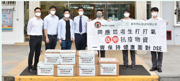
感謝華潤慈善基金、晶准醫學和青年同心協會有限公司送上物資

不少校友及社區機構在「疫」境中為母校送暖，將不同口罩收納套、口罩、消毒用品等抗疫物資，贈予母校以分發給有需要的同學，更為當屆文憑試考生打氣加油！